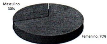
Gráfico No. 2 Distribución de Total de Egresados por Género según Área Mayo 2023 ITSC